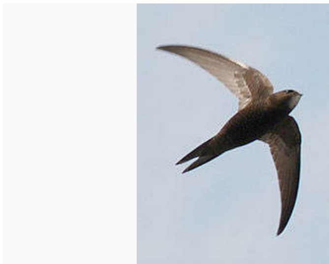
Jerzyk w locie

Drobne owady, które chwytają w locie szeroko rozwartym dziobem. Ponad połowę zdobyczy stanowią błonkoskrzydłe ponad 1/4 drobne chrząszcze , 10% muchówki a ok. 3% – małe motyle. Często jerzyki polują gromadnie, zwykle na dużych wysokościach. Mogą jednak również latać niżej nad łąkami (np. przed deszczem, podobnie jak jaskółki) lub też zniżać lot tuż nad powierzchnię wody, aby się napić. Zbierając pokarm dla piskląt, jerzyk gromadzi w podgardlu zbite w bryłkę owady. Przy niekorzystnej pogodzie (ochłodzenie, długotrwałe opady) może odbywać dalekie wędrówki na południe (nawet kilkaset kilometrów) w poszukiwaniu pożywienia.