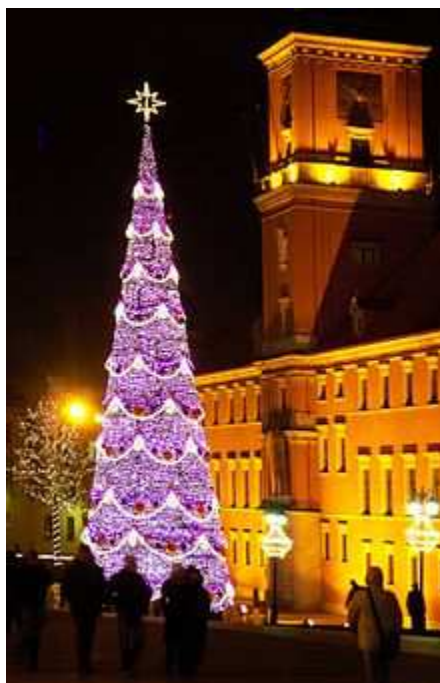
Choinka w Warszawie na Placu Zamkowym