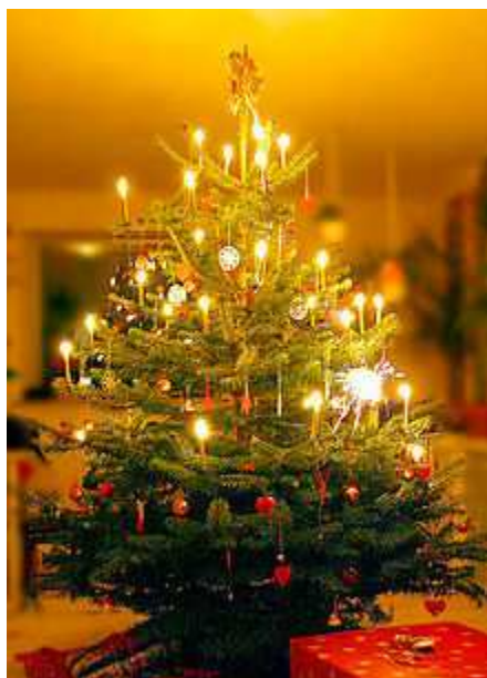
Choinka w domu